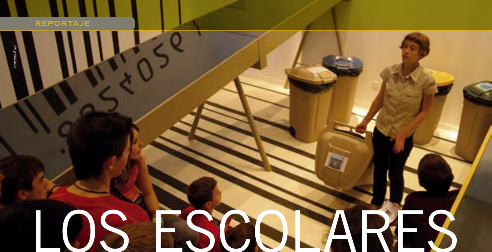
Un grupo de escolares durante su visita guiada al Eco-parque